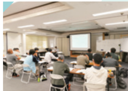
職長・安全衛生 責任者教育