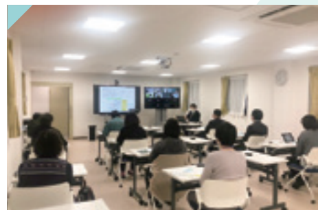
経営者向け セミナー