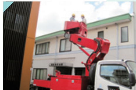
高所作業車 (10m未満) 特別教育